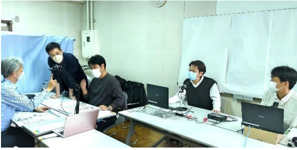
オンライン研修準備中のケアマネ連精鋭部隊 (10月31日はすぬま事務所にて)